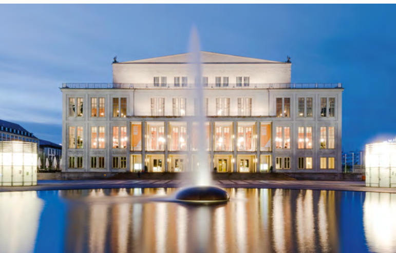
Das Opernhaus gehört zu den kulturellen Leuchttürmen der Stadt

Die Genehmigung des Zusatzhaushalts für die Leipziger Kulturbetriebe ist ein wichtiges Signal – gerade für die Oper und die rund 1.500 Beschäftigten in den städtischen Eigenbetrieben. Die Zustimmung des Stadtrats ist an Erwartungen geknüpft. Mehr Ticketverkäufe, zusätzliche Einnahmen durch Vermietungen, Fremdproduktionen und Sponsoring sowie mehr wirtschaftliche Eigenverantwortung sollen helfen, die Defizite zu begrenzen.