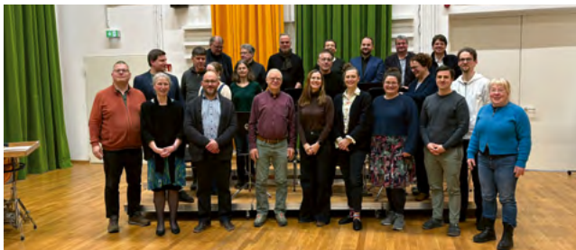
Engagierte Interessenvertreter: die Sächsische Orchesterkonferenz