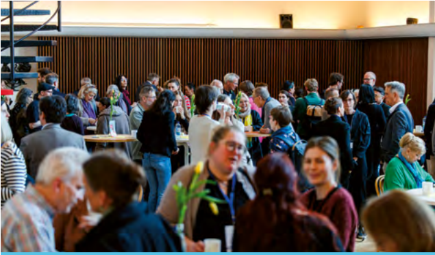
Netzwerken in den Pausen gehört bei Kongressen zur Tagesordnung

der Grundton des Kongresses Musikalische Bildung im Ökosystem Musik war optimistisch. Vernetzung und Zusammenarbeit wirkten und könnten Hürden überwinden. Musikrat-Präsidentin Lydia Grün sprach von einer Aufbruchsstimmung. Kulturstaatsminister Wolfram Weimer (parteilos) stellte in einem Grußwort mehr Mittel für den Bereich in Aussicht. Ad